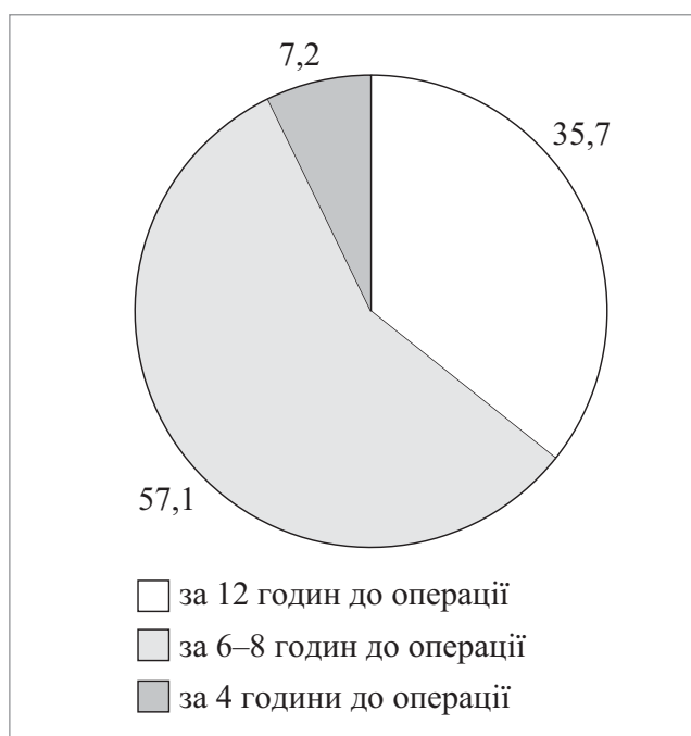
Рис. 1. Терміни припинення вживання твердої їжі перед операцією, яких дотримуються лікарі-анестезіологи м. Вінниці та Вінницької області (n=70) у разі планового кесаревого розтину

Перші міжнародні рекомендації щодо передопераційного голодування опубліковані