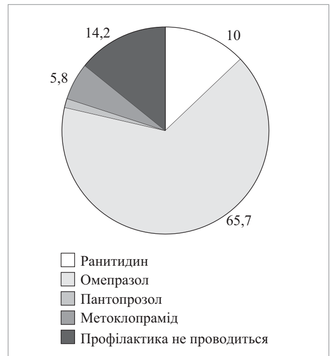
Рис. 3. Вибір лікарями-анестезіологами м. Вінниці та Вінницької області (n=69) препарату для фармакологічної профілактики аспірації в разі планового кесаревого розтину

Більше третини лікарів м. Вінниці та Вінницької області рекомендують пацієнткам надмірно тривале (12 і більше годин) передопераційне голодування, що, за даними літератури, може бути пов'язане зі збільшеним відчуттям