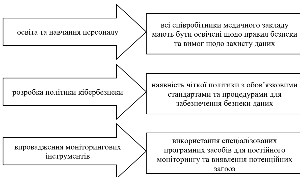
Рис. 2. Напрямки впровадження стратегії управління кібербезпекою

Забезпечення кібербезпеки у медичних закладах включає в себе вирішення таких викликів, як швидкий технологічний розвиток, зростання обсягів даних та зміна законодавства щодо захисту даних. Ефективна стратегія управління кібербезпекою повинна включати (рис. 2):