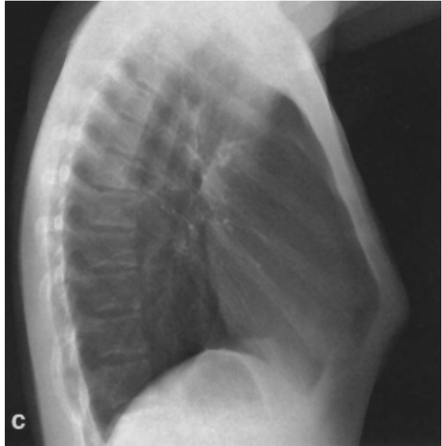
Рис. 1. Рентгенограма грудної клітки у правій боковій проекції з позначеними відстанями вимірювання

Застосування акушерського циркуля з метою визначення передньо-задніх розмірів грудної клітки при КДГК не дає достовірних результатів через відсутність відповідних анатомічних орієнтирів, від яких потрібно відштовхуватись при різних типах та формах деформації.