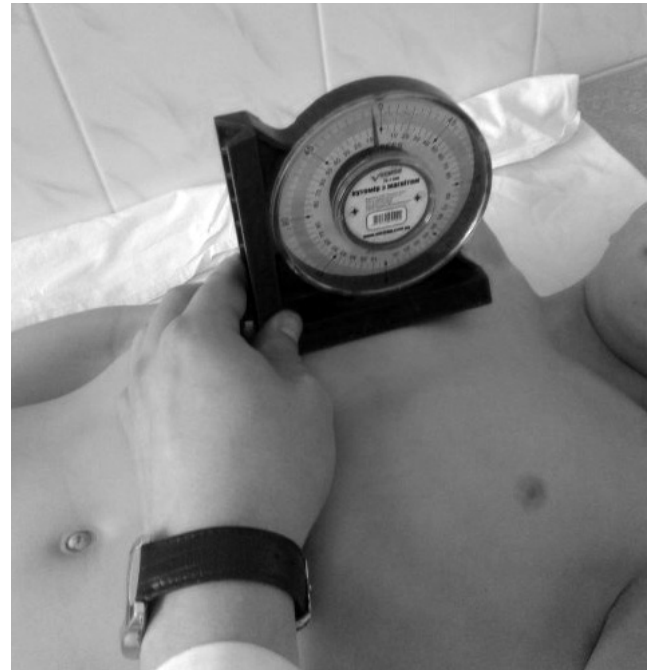
Рис. 3. Визначення кута відхилення груднини та пригруднинних ділянок у здорової дитини

Серед дітей з ВКДГК, нами відібрано 92 пацієнти різного віку з II та III ступенем деформації, яким по-