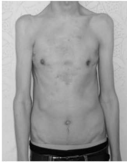
Рис. 2. Фотографія пацієнта Б. 16р. Історія хвороби №10971. Діагноз: вроджена асиметрична зліва, кілеподібна деформація грудної клітки III ступеню, реберно-грудинний тип, ротована грудина, неправильна форма, стадія субкомпенсації. Синдром Марфана, аномалія правої підключичної артерії, дистальний рефлюкс-езофагіт. Вигляд спереду (після операції).