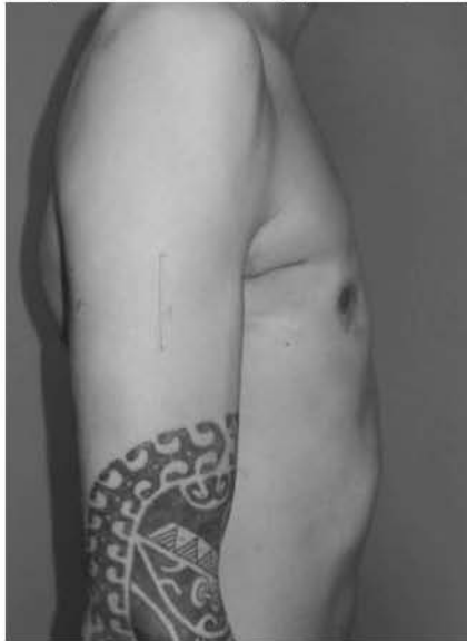
Рис. 4. Фотографія пацієнта Б. 20р. Діагноз: вроджена асиметрична зліва, кілеподібна деформація грудної клітки III ступеню, реберно-грудинний тип, ротована грудина, неправильна форма, стадія субкомпенсації. Синдром Марфана, аномалія правої підключичної артерії, дистальний рефлюкс-езофагіт. Вигляд збоку (через 4 р., після операції).

пригрудинних ділянок по правій та лівій пригрудинних лініях від третього ребра склали 23° та 22° відповідно. Індекс кілеподібної деформації до операції - 1,21.