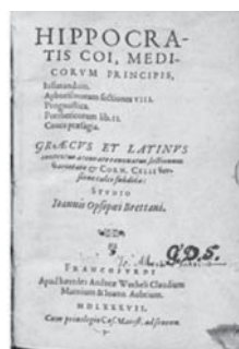
Гіппократ «Про прорізування зубів»