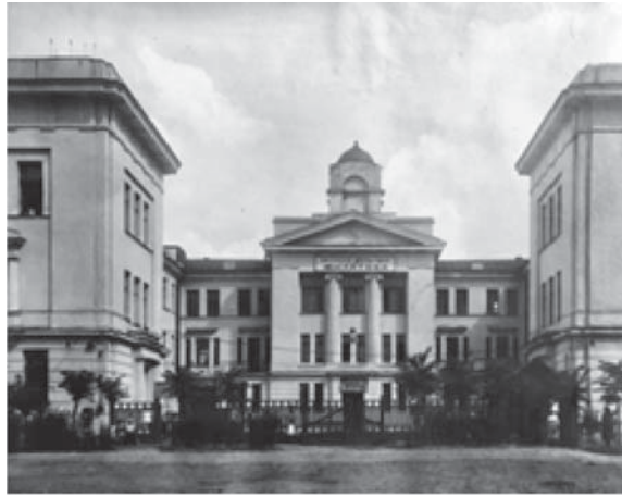
Дитяча лікарня імені Філатова