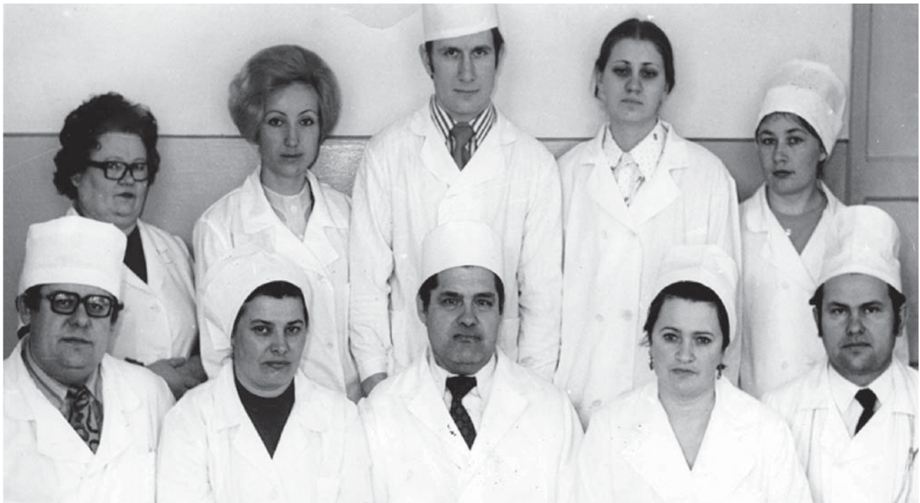
Колектив кафедри госпітальної педіатрії у 1974 році