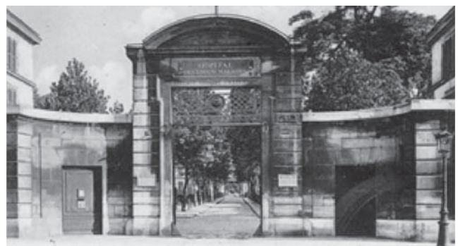
Hopital des Enfants–Malades у Парижі