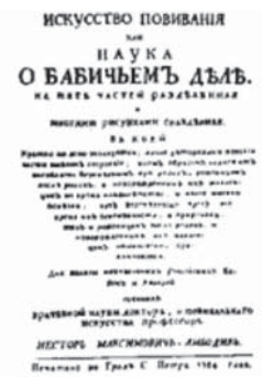
Титульний лист книги Н.М. Амбодік–Максимовича «Искусство повивания» (1784)

Співробітники кафедри займалися підвищенням кваліфікації лікарів-педіатрів, поліпшенням якості роботи усієї системи дитячих лікувальних закладів, медико-санітарного обслуговування дітей в яслах, дитячих садках, школах м. Вінниці.