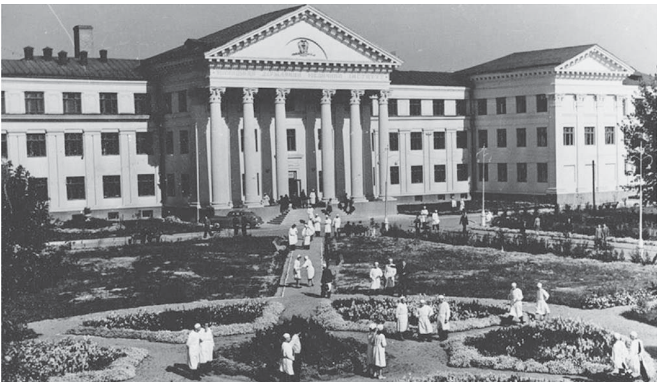
Вінницький медичний інститут