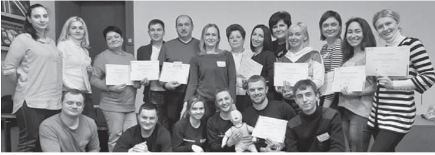
Колектив кафедри на тренінгу PBLs