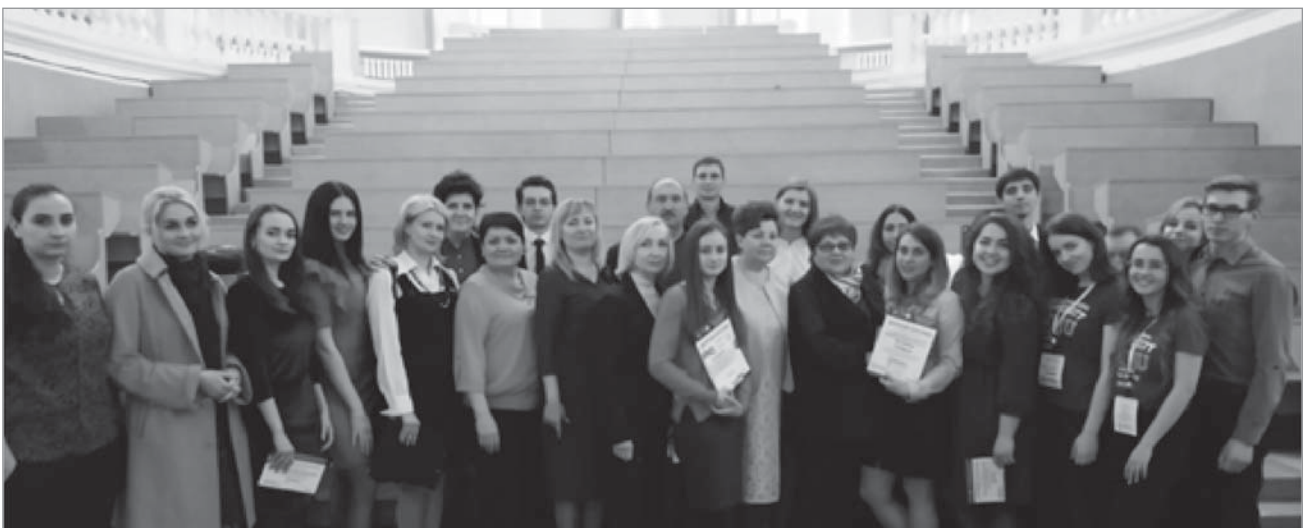
Учасники студентської наукової конференції

Лікувально-консультативна робота виконується співробітниками кафедри на базі Вінницької обласної дитячої клінічної лікарні в таких відділеннях: онкогематологічне, педіатричне № 2, педіатричне № 1, інфекційно-боксоване діагностичне відділення для дітей старшого віку, інфек-