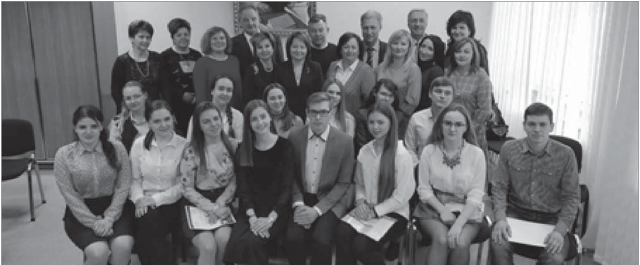
Учасники Всеукраїнської студентської олімпіади

ційно-боксоване відділення для дітей раннього віку та консультативна робота з питань медичної генетики у всіх відділеннях лікарні, діагностична робота в ендоскопічному кабінеті лікарні.