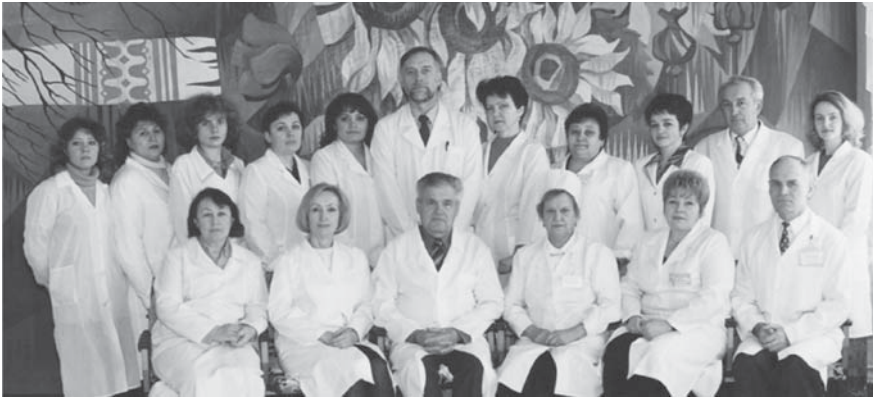
Колектив кафедри дитячих хвороб із курсом медичної генетики, 1998 рік