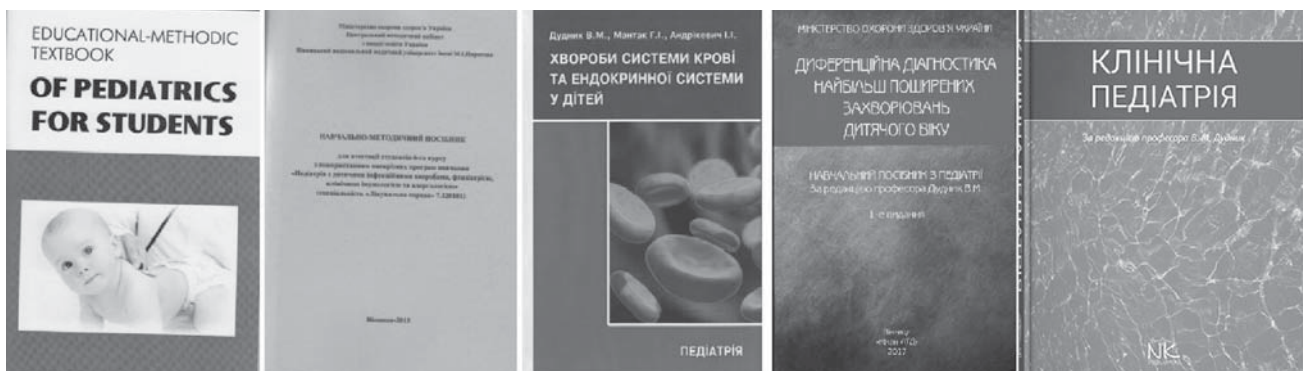
Друковані видання кафедри

Видано методичні рекомендації МОЗ України «Діагностика та медикаментозна корекція анемічного синдрому при ревматоїдному артриті у дітей», 4 інформаційні листи, монографії і «Еритропоетин. Біологіческие свойства и клиническое применение», «Анемія при ювенільному ревматоїдному артриті», навчальний посібник МОЗ України для студентів V курсу «Хвороби системи крові та ендокринної системи у дітей. Педіатрія», для студентів VI курсу «Диференційна діагностика найбільш поширених захворювань дитячого віку», підручник для студентів і лікарів-інтернів «Клінічна педіатрія (2021)». Видано 10 посібників і методичних рекомендацій МОЗ України.