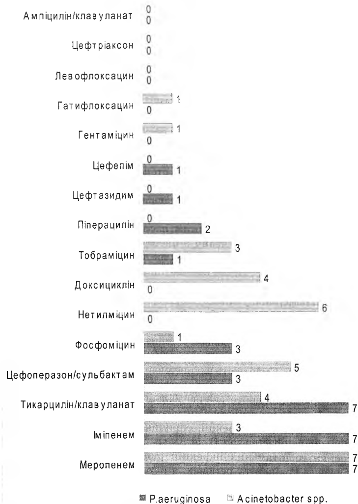
Рис. 1. Кількість ізолятів P. aeruginosa та Acinetobacter spp., чутливих до різних антибактеріальних засобів.