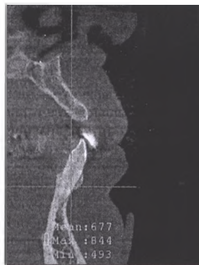
Рис. 3. Щільність кортикальної пластинки при пародонтиті середнього ступеня важкості у хворих без проявів бруксизму, визначена в одиницях Хаунсфілда (зображення з вікна програми «iCATVision»).