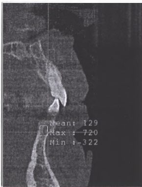
Рис. 1. Щільність кістки альвеолярного відростка при пародонтиті середнього ступеня важкості без проявів бруксизму, визначена в одиницях Хаунсфілда (зображення з вікна програми «iCATVision»).

На всіх ортопантомограмах кісткова тканина мала петлястий малюнок. Відомо, що він залежить від щільності вертикальних і горизонтальних кісткових балок. Найінтенсивніший малюнок дають ті трабекули, які є функціональними й отримують найбільше навантаження. Якщо на верхній щелеп це вертикальні кісткові балки, то на нижній навантаження передається від зубних альвеол горизонтально по тілу щелепи, й найбільший тиск випробовують саме горизонтальні балки, тому вони більш виражені на рентгенограмах нижньої щелепи [2].