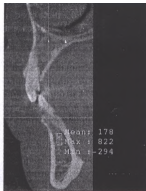
Рис. 2. Щільність кістки альвеолярного відростка при пародонтиті середнього ступеня важкості у хворих із скаргами на бруксизм, визначена в одиницях Хаунсфілда (зображення з вікна програми «iCATVision»).