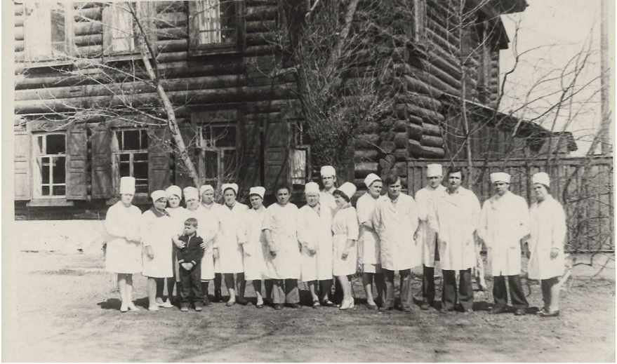
З колегами зі стоматологічної поліклініки. Мінусинськ (Росія), 1976 р.