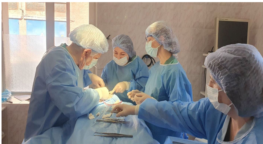
Щелепно-лицеве відділення Вінницької обласної клінічної лікарні ім. М. І. Пирогова. Вінниця, 2025 р.