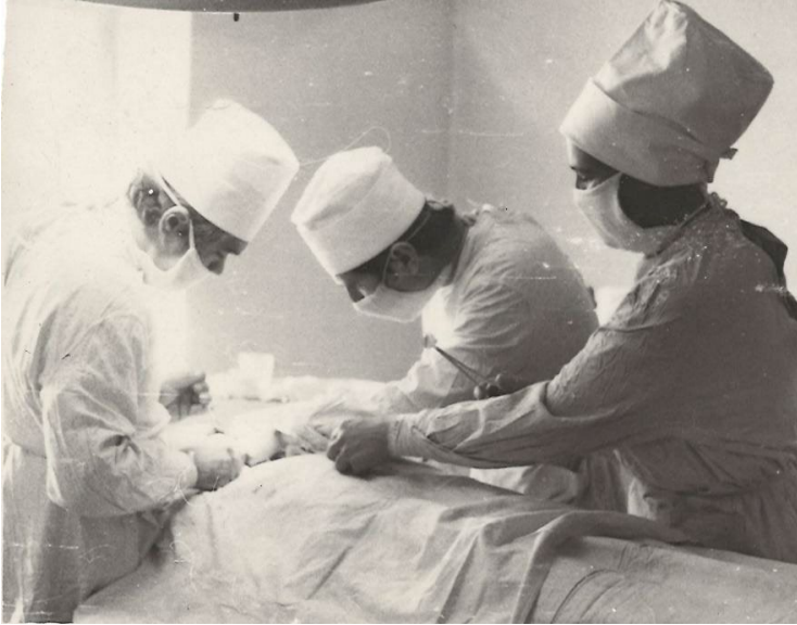
Мінусинськ (Росія), 1975 р.