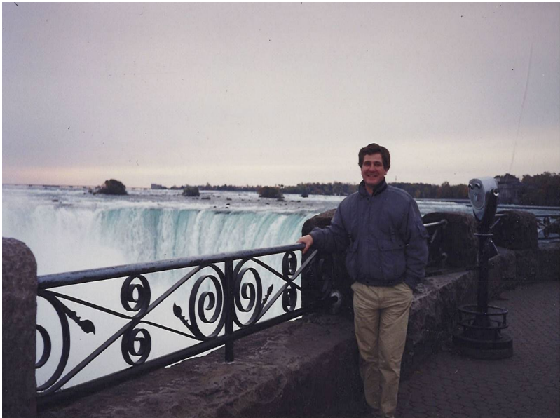
Ніагарський водоспад. 2001 р.