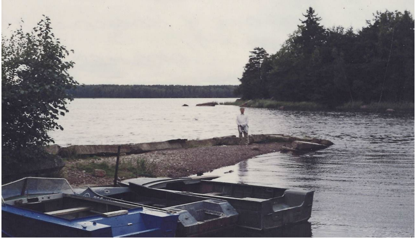
Рідне селище Іоханес