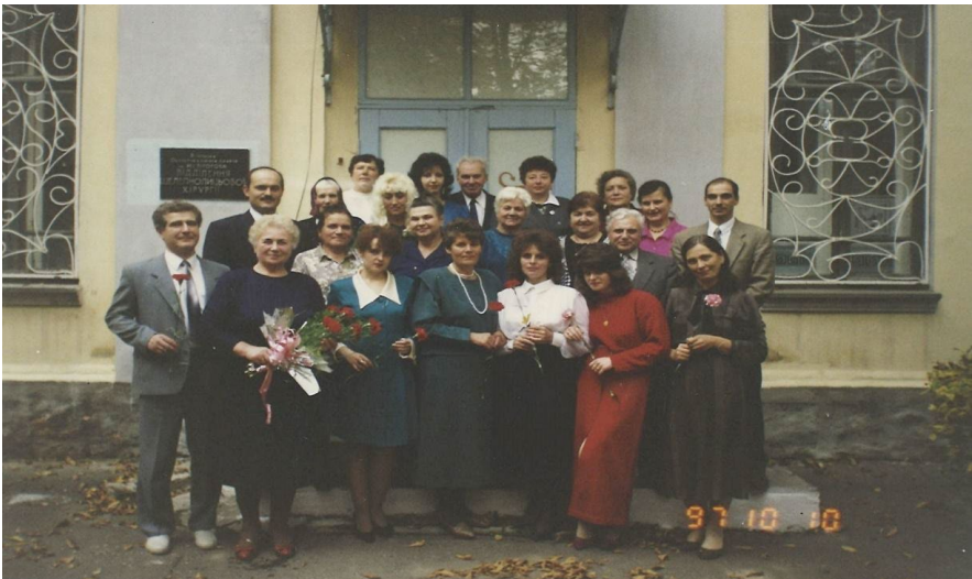
З колегами з відділення щелепно-лицевої хірургії Вінницької обласної клінічної лікарні ім. М. І. Пирогова. Вінниця, 1997 р.