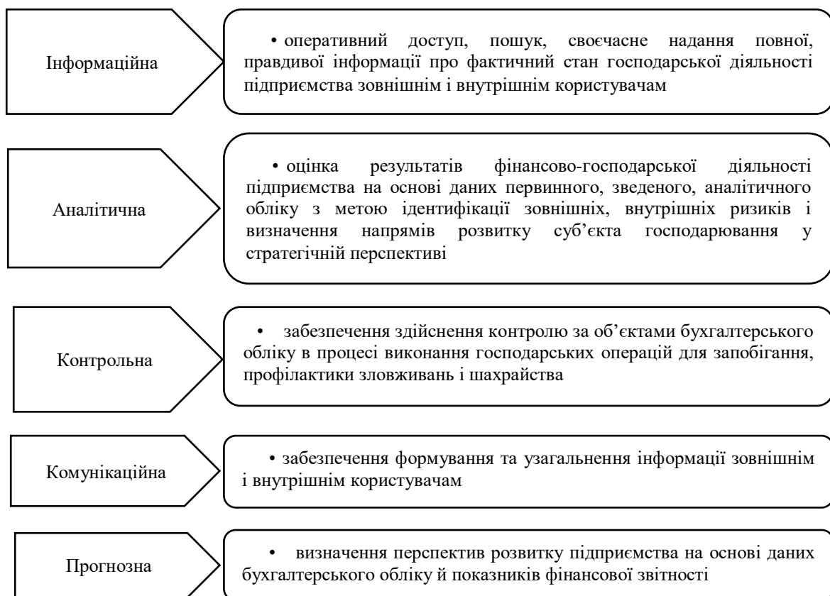
Рис. 1. Функції автоматизованого бухгалтерського обліку

За допомогою автоматизованого бухгалтерського обліку посилюються оперативність функцій обліку (рис. 1).