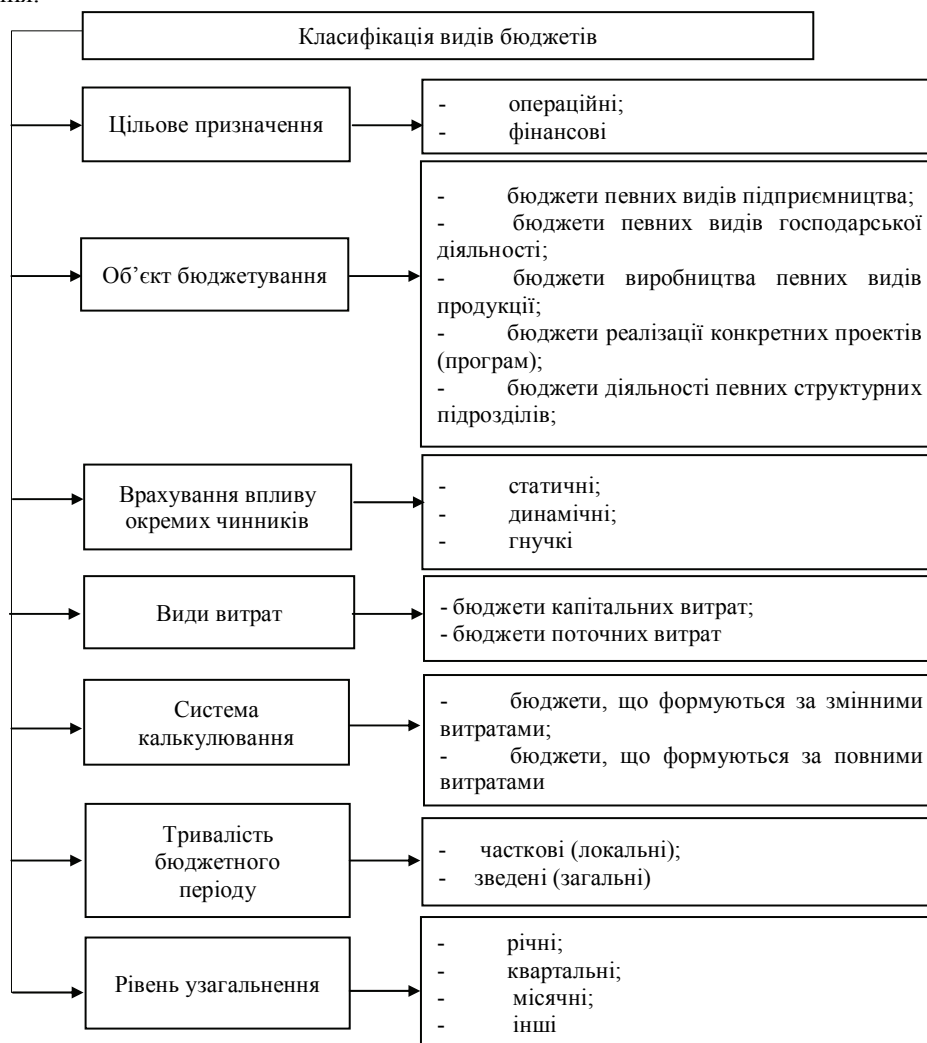
Рис. 1. Класифікація видів бюджетів за ознаками [систематизовано авторами на основі [14]]

5. Здійснення бюджетування, що вимагає певних змін в системах обліку і контролю та навчання спеціалістів, які відповідають за складання бюджетів, керівників центрів відповідальності та вищого рівня управління основам планування, організації контролю і аналізу. Облік організовується за центрами відповідальності.