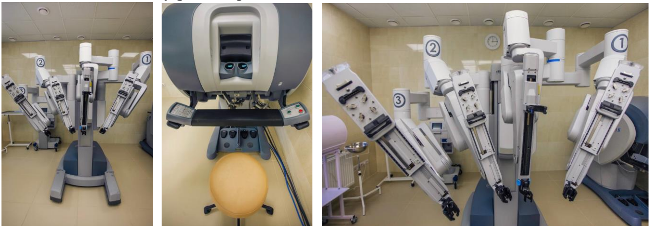
Рис. 1 Роботасистована система Da Vinci

Висновки: вивчення цих предметів забезпечує студентам медичних факультетів необхідні знання та навички для успішної професійної практики у галузі акушерства та гінекології, а також покликане покращити якість медичної допомоги для жінок у різні періоди їхнього життя.