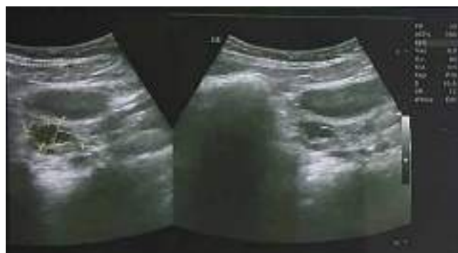
Рис. 4. Параоваріальна кіста правого яєчника в дівчинки віком 14 років

УЗД, досягали 9–10 см у діаметрі, але в середньому становили близько 5 см. Лютеїнові кісти на ехограмах мали вигляд утворень із потовщеними стінками та неоднорідним ехогенним вмістом. При цьому таке явище завжди супроводжувалось ефектом дистального посилення.