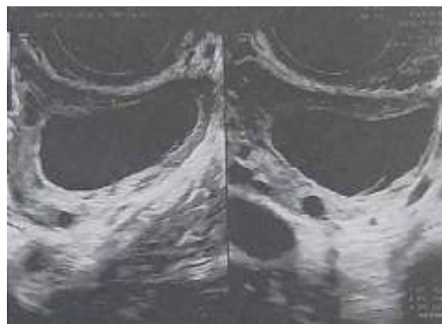
Рис. 2. Фолікулярна кіста лівого яєчника в дівчинки віком 12 років

У II групі здебільшого (87 (87%) дітей) артеріальний кровотік локалізувався в стінці апендикса, у 13 (13%) дітей – у навколишній клітковині біля апендикса.