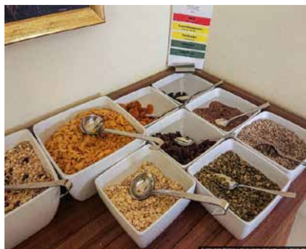
Рис. 3. Вигляд «шведського столу» в одній клініці Medical Park Berlin Humboldtmühle (Німеччина)