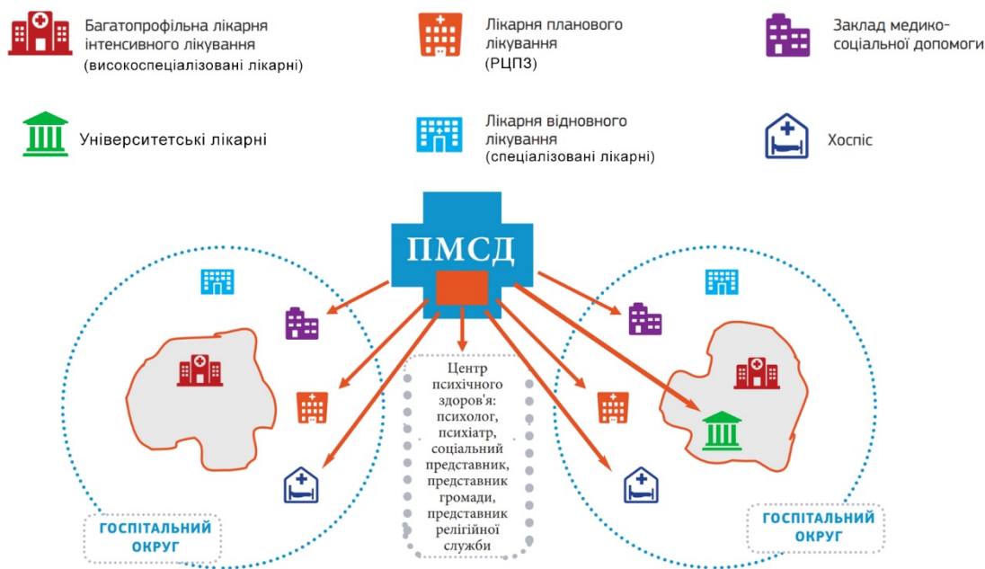
Рисунок 1. Схема надання медичної допомоги особам з порушенням психічного здоров'я на різних рівнях системи охорони здоров'я

Ми пропонуємо нову модель надання психолого/психіатричної допомоги на різних рівнях надання якісної медичної допомоги особам з психічними розладами (згідно МК-10, 11: розлади психіки та поведінки (F00-F99) від органічних, соматичних психічних розладів, депресії, тривожні стани, «хронічний синдром на робочому місці, з яким працівник своєчасно не впорався» – це розлади адаптації (F43), вигорання (Z73.0), неврастенія (F48), до не уточненого психічного розладу які повинні отримувати лікування не лише в психіатричних лікарнях, які були побудовані у XVIII-XIX столітті, і в яких після лікування на все життя залишиться ярлик «психічно хворий». Тому ми пропонуємо наступну модель на різних рівнях надання медичної допомоги, ураховуючи взаємодію між рівнями надання медичної допомоги окремими службами з вторинними рівнями надання психіатричної допомоги рис.1.