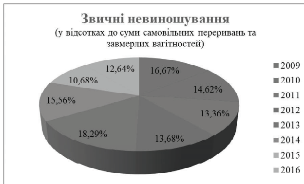
Рис. 1. Кількість випадків звичного невиношування.

у правій матковій артерії у жінок основної групи склало 0,89 \pm 0,24 ; в групі жінок контрольної групи - 1,25 \pm 0,25 . Середнє значення ІР в лівій матковій артерії у жінок основної групи становило 0,94 \pm 0,25 ; у жінок контрольної групи - 1,16 \pm 0,19 . Середнє значення пульсаційного індексу в правій матковій артерії у жінок основної групи склало 2,08 \pm 0,20 ; в групі жінок контрольної групи - 2,47 \pm 0,28 . Середнє значення ПІ в лівій матковій артерії у жінок основної групи становило 2,01 \pm 0,18 ; у жінок контрольної групи - 2,18 \pm 0,19 .