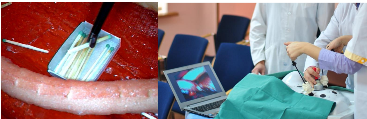
Рис. 2. Тренування практичних навиків перекладання сірників з використанням створеного студентами лапароскопічного тренажеру.

ни; 3. З метою точної координації рухів при маніпуляції лапароскопічними інструментами виконувати наступні вправи: перекладання сірників в лапароскопічному тренажері, кілець, відпрацювання техніки «захвату» (рис. 2); 4. Різання ножицями при лапароскопії (для цього в черевну порожнину за допомогою затискача вводимо лігатури); 5. Зав'язування вузлів при лапароскопії. Для цього в черевну порожнину вводиться забарвлений шовний матеріал. Потрібно зав'язати вузли за певний проміжок часу; 6. Відпрацювання техніки вузлового та безперервного швів за допомогою лапароскопічного тренажера. Шов в лапароскопічному тренажері є одним з найважчих завдань при лапароскопії.