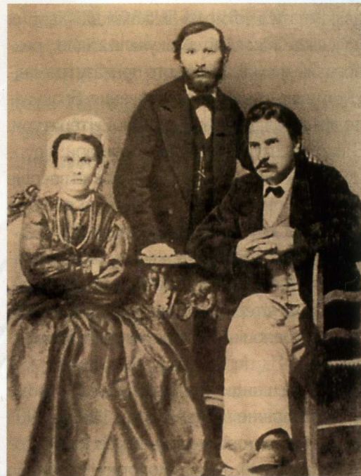
Степан Руданський з сестрою Ольгою та братом Григорієм. Фото 60-х років XIX ст.

Багато часу займала громадська діяльність — Руданський був головою межевої