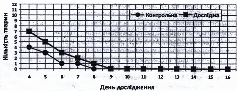
Рис. 1. Динаміка прояву виразки при загоєнні травматичних ран слизової оболонки щоки пацюків усіх груп дослідження (n=20).

На 10 день з моменту початку експерименту у 3 тварин (30%) контрольної групи, ще спостерігались процеси епітелізації, а у 7 щурів із 10 (70%) відмічалось повне загоєння пошкодження, на противагу тваринам у аналогічній дослідній групі. Ранова поверхня пошкодження слизової оболонки щоки тварин у яких відмічене повне загоєння ран була повністю вкрита тонким епітеліальним шаром, який не відрізняється від оточуючої травми слизової оболонки. Візуально товщина травмованої щоки наближувалась до товщини контрлатеральної щоки, що свідчить про відсутність проявів запальної реакції в товщині всієї слизової оболонки. У щурів дослідної групи на 10 день з моменту пошкодження слизової оболонки порожнини роту та пересічення загального жовчного протоку у 8 із 10 (80%) тварин залишалось реєстрування епітелізації рани, при цьому лише у 2 щурів (20%) відмічене повне загоєння травмованої рани слизової оболонки щоки, що є підтверд-