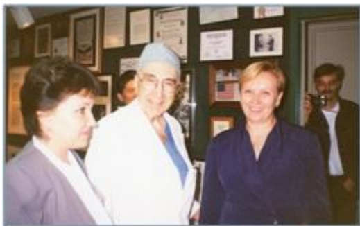
Підвищення кваліфікації у США. 1998 р. З відомим кардіохірургом Майклом Дебейкі.

і заступником голови Апробаційної Ради, членом Дисертаційної Ради при Вищій міжнародній (під егідою ВООЗ) школі суспільної охорони здоров'я Республіки Казахстан, тісно працювала з міжнародними організаціями: гілками ООН (ЮСАІД, ЮНІСЕФ), ВООЗ, Агентством США з міжнародного розвитку, Агентством США з розвитку освіти тощо. У часи Радянського Союзу я мріяла про відвідування інших країн, мені було дуже цікаво побачити на власні очі життя людей в інших країнах. Тоді це було майже неможливим. Але в 90-х роках ХХ століття