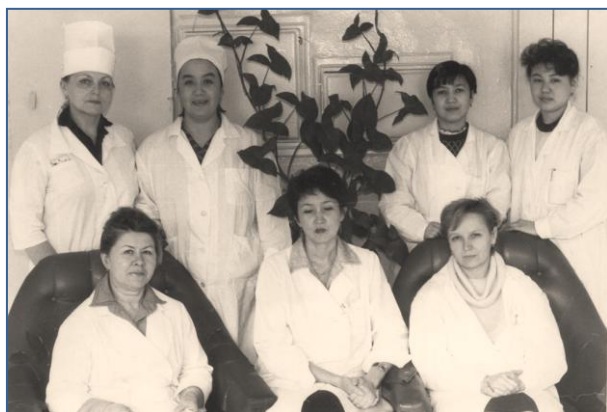
З колегами відділення хронічної коронарної недостатності Республіканського інституту кардіології. Алмати, 90-ті рр.

1984 рік наша родина зустріла у Чехословаччині – за новим місцем військової служби чоловіка. Прослужили-прожили в цій країні 6 років і повернулися у 1991 році в Алма-Ату, у Казахстан. В нашій родині на той час було вже 3 донечки – молодша народилася у Чехословаччині. Роки служби за кордоном пройшли, як завжди, в роботі, у турботі про дітей, у родинній любові, в добробуті. Поїхали за кордон із однієї країни – СРСР, а повернулися – в іншу, розірвану на окремі держави. Соціальна криза, моральна криза, ідеологічна криза, фінансова криза – і все це у повній мірі. Всі зміни у великій країні відбувалися швидко. Ми взагалі не були готові до такого, але треба було жити, рости дітей, працювати. Молодшій донечці виповнилося тільки 1 рік 2 місяці і мені було не під силу повернутися на місце завідувача кардіологічного відділення клінічної лікарні, яка ще й знаходилася далеко за містом. Влаштувалася молодшим науковим співробітником у відділення хронічної коронарної недостатності республіканського науково-дослідного інституту кардіології, який знаходився недалеко від нашого житла.