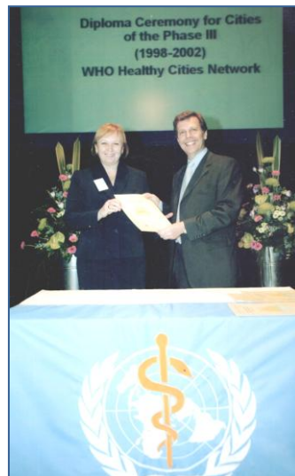
Вручення диплома ВООЗ за участь у міжнародний проектах з охорони здоров'я Республіки Казахстан. 2002 р.

У 2002 році ВАК Казахстану надав мені вчене звання доцента, у 2003 році – вчене звання професора. Під час роботи в наукових організаціях була членом і заступником голови Вченої Ради, членом