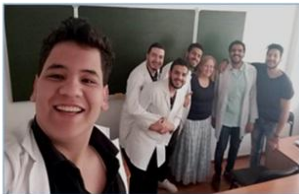
З англійською групою студентів, 2018 р.