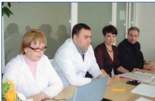
На державних іспитах, 2015 р.

Проводиться навчально-наукова робота із студентами на лекціях і практичних заняттях, при виконанні курсових і студентських наукових робіт, при підготовці доповідей на республіканські та міжнародні конференції, підготовці до Всеукраїнських студентських олімпіад з фармації та фармакології.