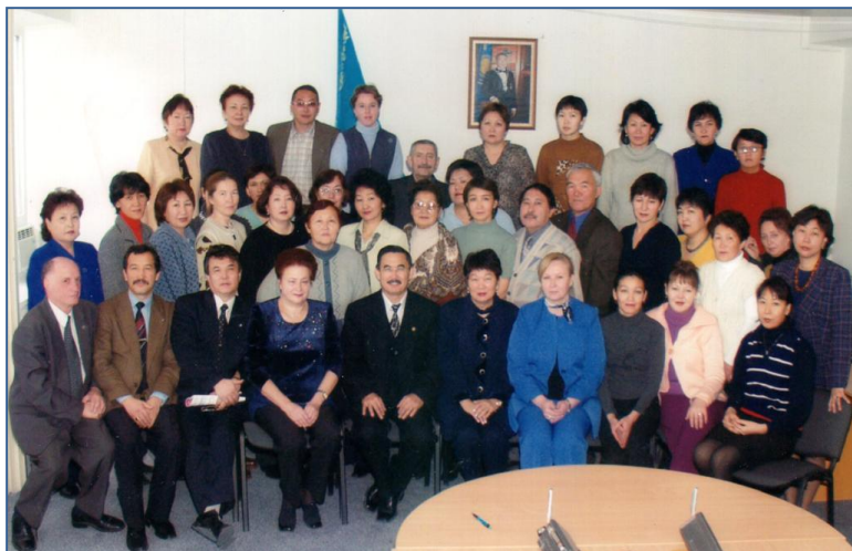
Науковий Центр МОЗ Казахстану, 2003 р.

Після роботи в науково-дослідному інституті кардіології мені довелося працювати провідним науковим співробітником, потім – завідувачем відділу в Науковому центрі медичних та економічних проблем охорони здоров'я МОЗ Республіки Казахстан.